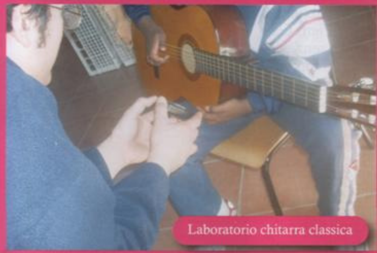
Laboratorio chitarra classica