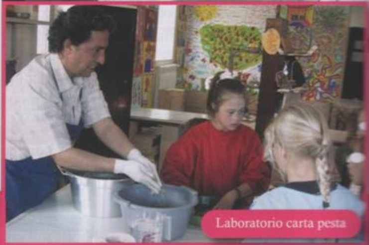
Laboratorio carta pesta